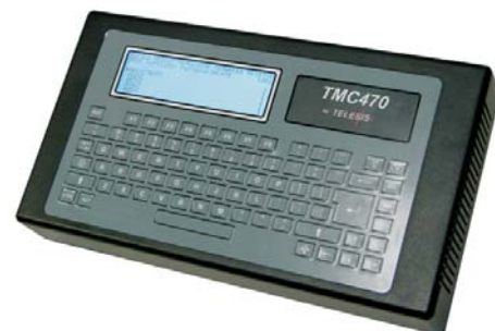
Компактный автономный контроллер TMC470