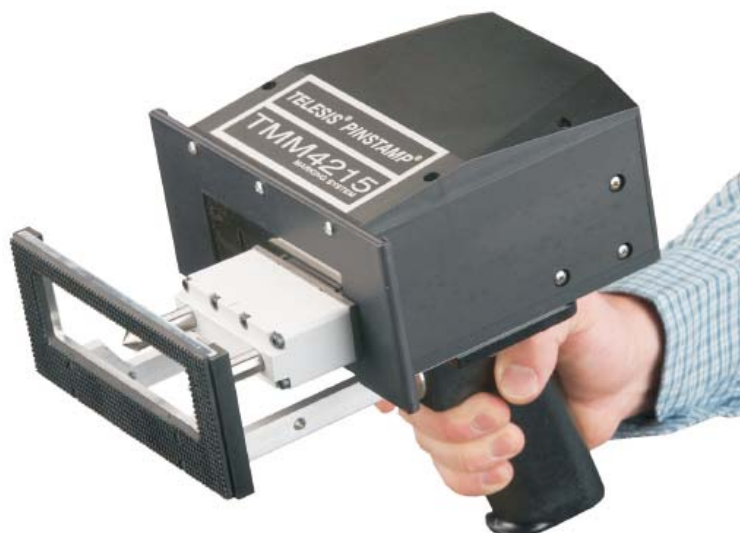
Головка на фото с опционным защитным экраном

Окно маркировки двухигольной установки TMM4215 составляет 100x13мм. При этом она имеет лёгкий вес и удобна при портативном и интегрированном применении.